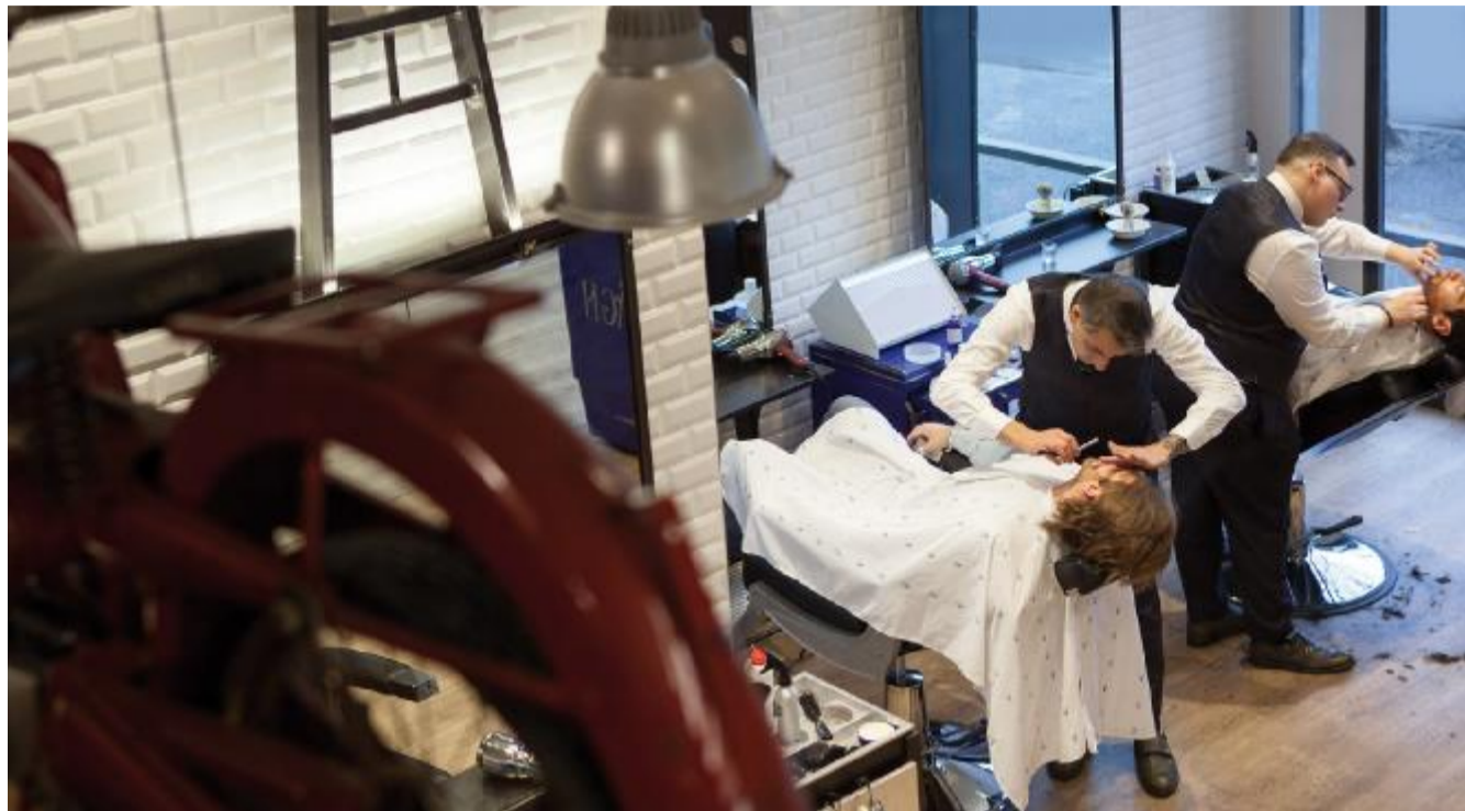
Anche a Brescia le barbierie stanno tornando in grande stile come luoghi in cui concedersi un rituale fino a pochi anni fa appannaggio delle persone «over»

I saloni di barberia tornano in grande stile: all'«Argagn» di via Filzi il taglio diventa una scusa, fra lounge bar e vendita di mobili vintage