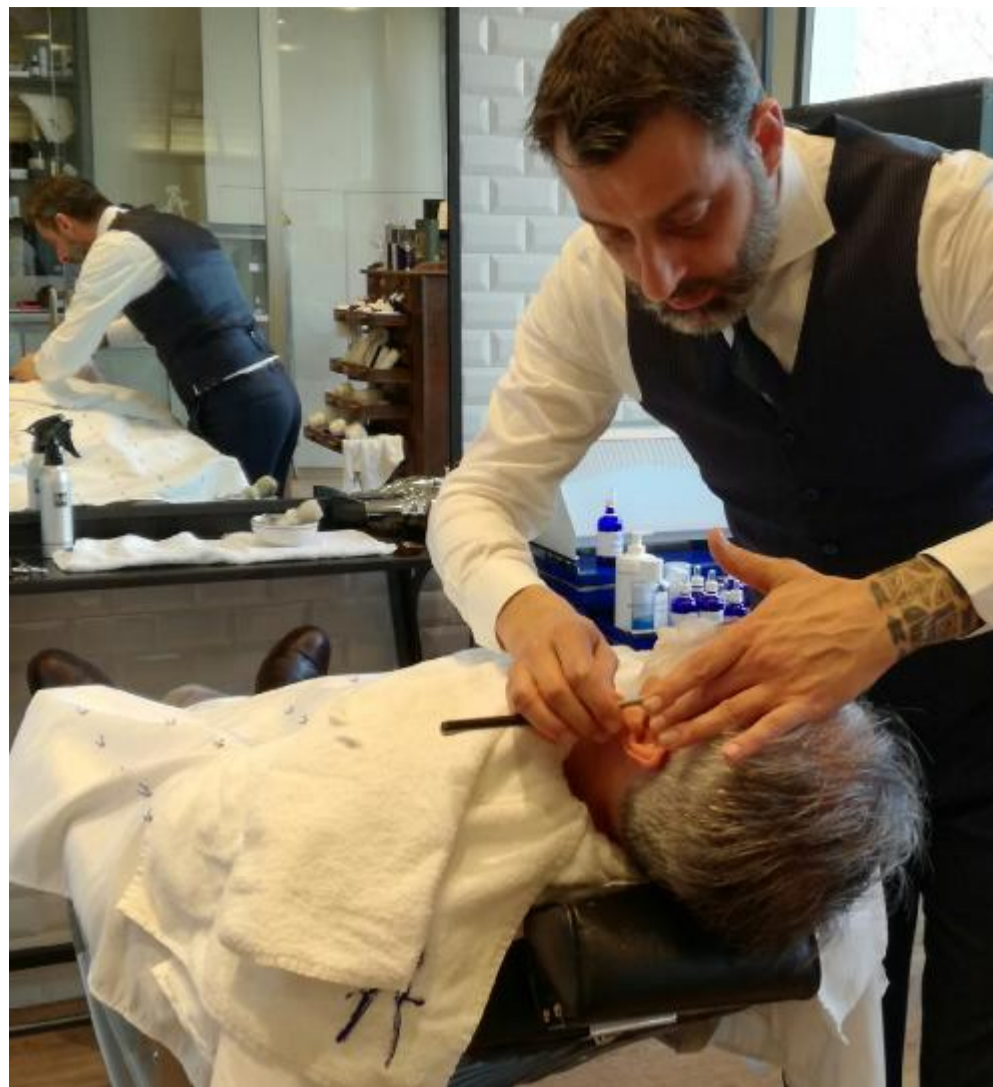
Mentre a casa si usa un rasoio normale, il barbiere utilizza rigorosamente la lametta a mano libera

Barba e capelli sono la scusa per diventare di casa, una coccola fatta con gran maestria, che prevede un rituale composto da tre pose con teli caldi più quello freddo finale.