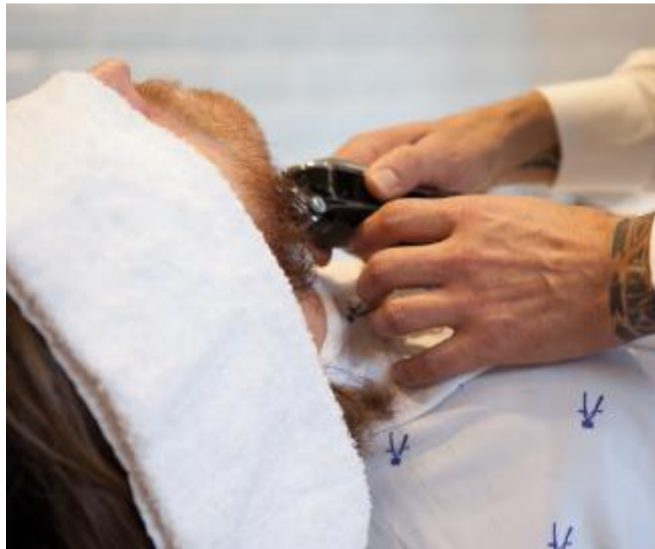
Avere una barba curata e ben in evidenza oggi è una moda